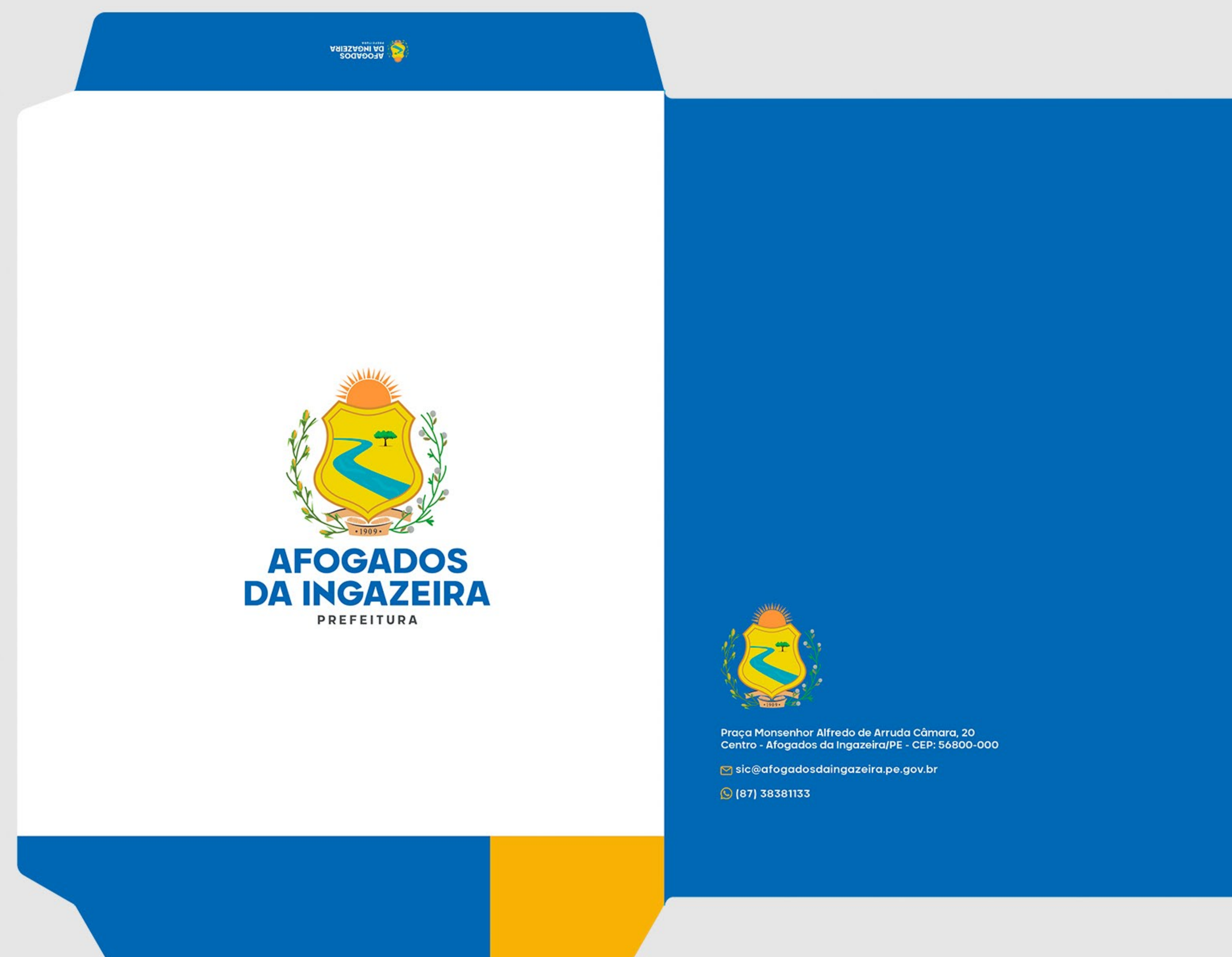
Modelo de Envelope Saco 22,5 x 31,1 cm